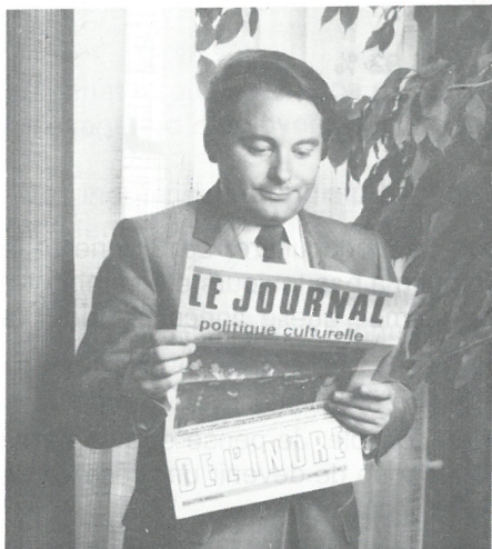
André Laignel, Député Maire d'Issoudun. Pour 79 % des lecteurs.